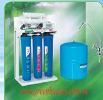
Máy lọc nước R.O 35 lít + 50 lít + 65 lít