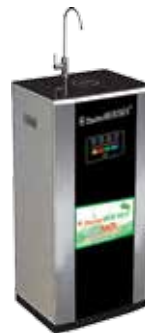
Máy lọc nước R.O 9 cấp vỏ kính cường lực