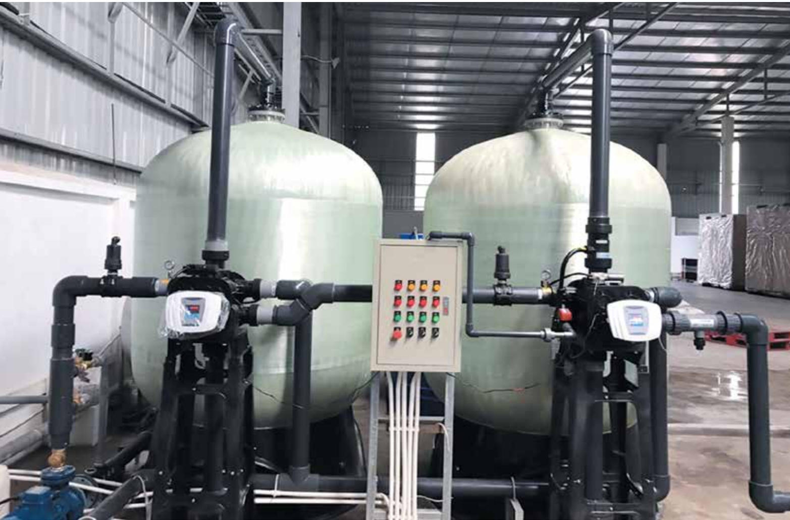
hệ thống xử lý nước chung cư công suất 150 - 200 - 300 m 3 /ngày đêm